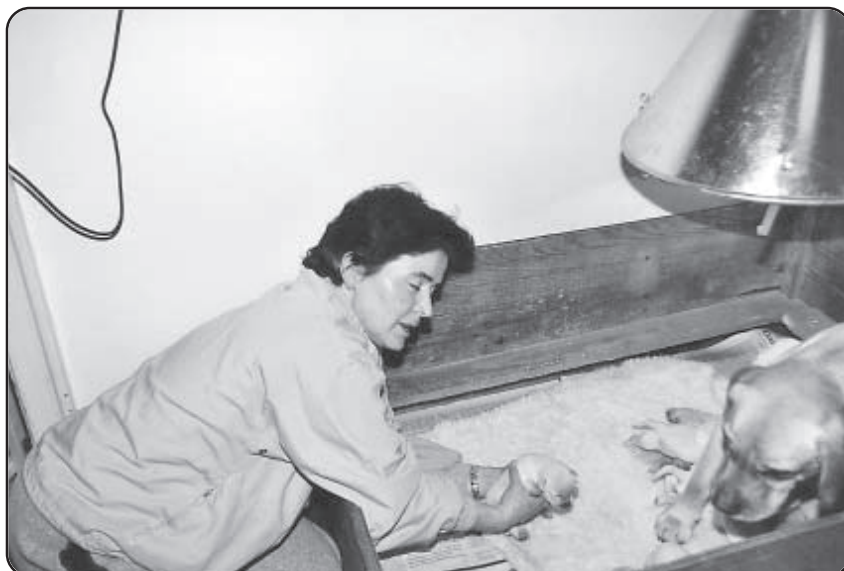
Man ser tydeligt, hvordan han prøves at undvige -

Det er eksempelvis unaturligt for en hund at gå i snor – i flokken ved hver og én, hvordan rækkefølgen skal