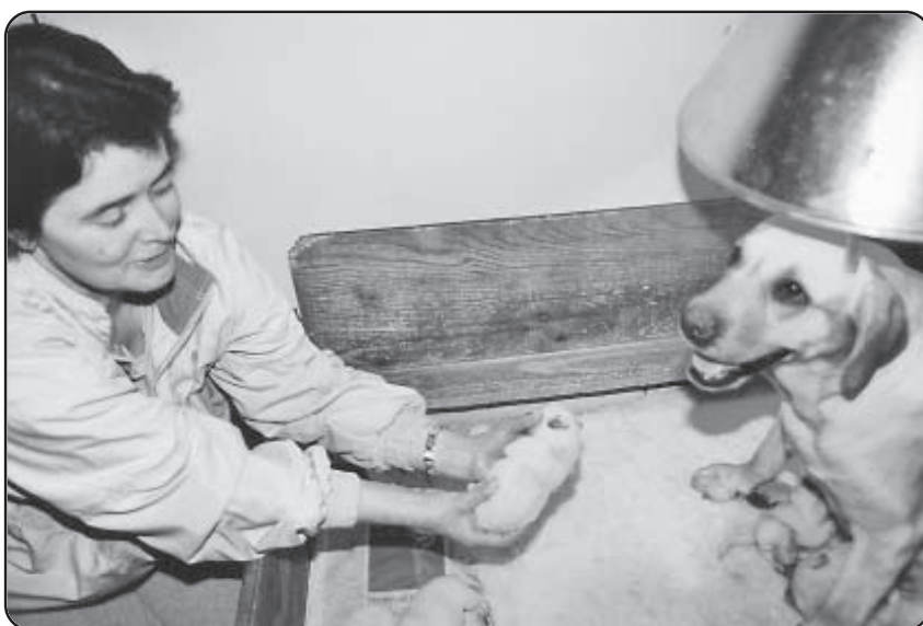
Man ser her, hvordan denne hvalp krummer sig sammen og trækker halen op under sig

præges på samme fært kan man allerede fra 1. levedøgn smøre den/de ønskede fært(e) på tævens dievorter i forbindelse med måltiderne - det er færtprægning, der vil noget og hvalpene får i ordets bogstaveligste forstand færten ind med modermælken!!