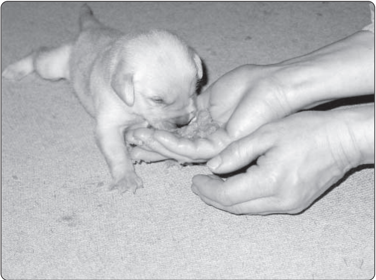
"Energiltførsel" før sporet - her ses tydeligt, hvor lille hvalpen er

Af skovdistriktets øvelseskalender fremgår ikke, at der skulle have været nogle øvelser, så vi kontakter Militærregionen.