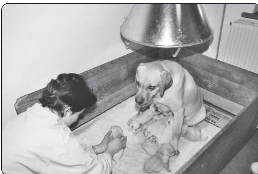
- og fortsætter ned over "angrebepunktet"

gen frem til ca. 6 mdr's alderen er målrettet hvalpens fremtidige virke.