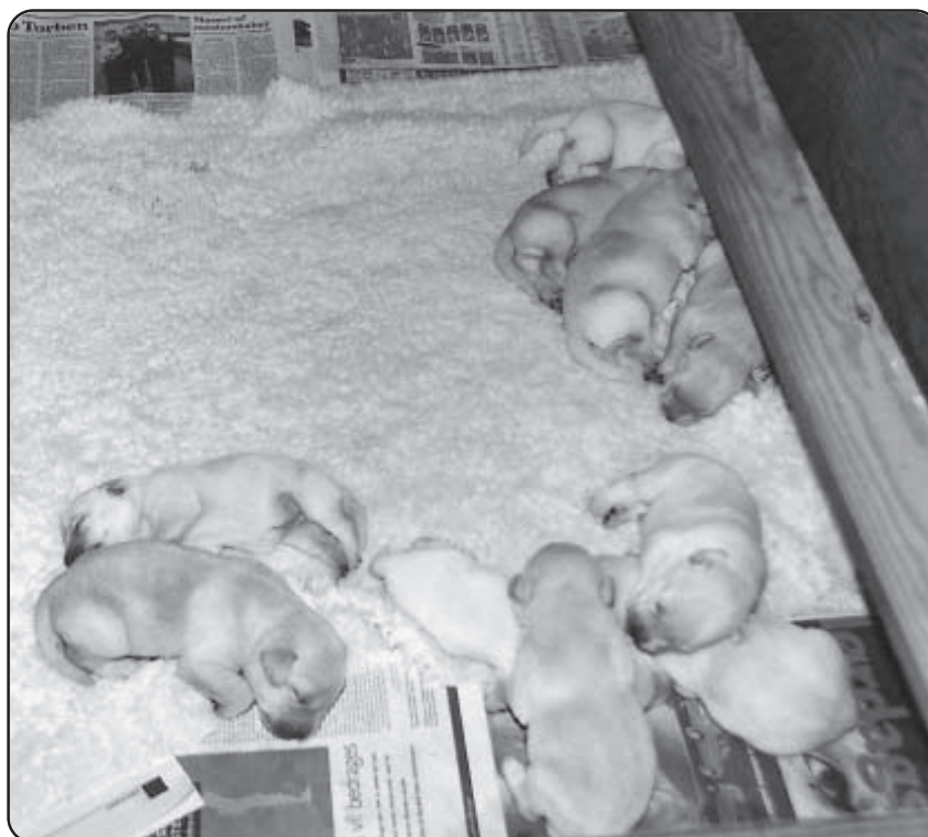
Kommende stjerner indenfor bombe-, narkotika-, kantarel-, trøffel-, pengesøgning eller andre spændende former for nytænkning?? 10 dejlige gule labradorhvalpe født om natten under fuldmåne og orkan