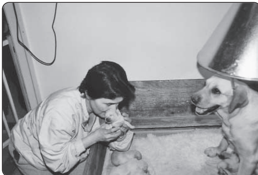
Hvalp udvælges til færtprægning

Samtidig med udlægning af madspor trækkes klud med ønskede færtprægning. Kluden lægges sammen med – gerne over – kødet!