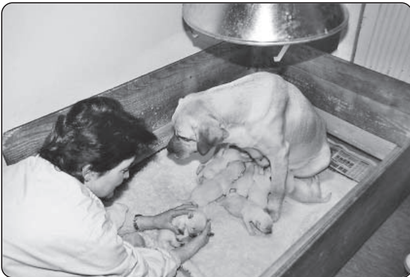
Den tredje hvalp tages ud og mentaltestes

Efterhånden som hvalpen bliver mere stabil på benene, er der faktisk ingen grænser for opfindsomheden – så længe opgaverne holdes indenfor de fysiske rammer, hvalpen kan præstere.