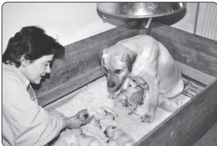
Den bliver forsigtigt lagt ned i kassen igen -

færten minimeres og den ønskede prægningsfært forstærkes.