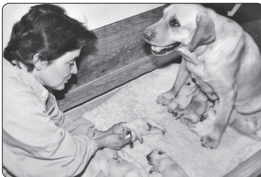
- mens "hash"kluden lægges blidt mod dens næse. - Når næseborene vibrerer tages kluden væk og hvalpen lægges blidt tilbage i mors trykke favn

Der arbejdes med forskellige variationer (snoninger, skarpe sving, små overspring osv.) – alt imens kød-