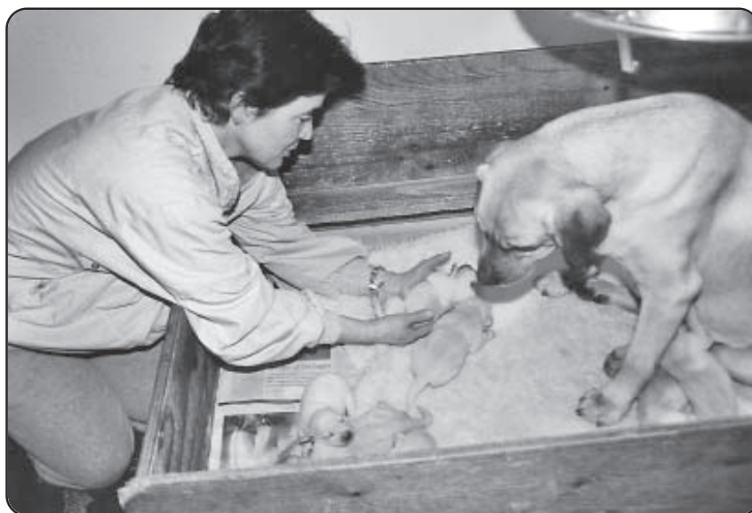
Man ser her, hvordan hvalpen forsøger at trække sig op og ud af hånden hen mod sin mor

Det er en allroundhund, som alle kan arbejde med på fornuftigt plan – dog ikke narkotikahund.