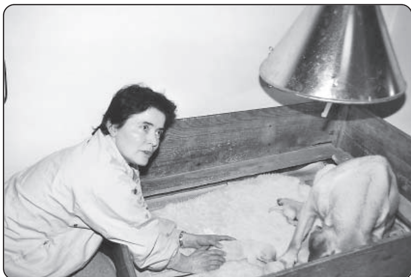
- og har kurs hen mod mors tryghed

Indlæringen foregår fra hvalpens side stort set uden forbehold – den stoler ubetinget på sin fører og følger denne med selvfølgelighed overalt i samme tillid, som den typisk ville udvise til en eller flere fra flokken.