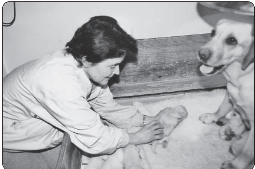
Mens der afsluttes med en blid stryging ned over ryggen